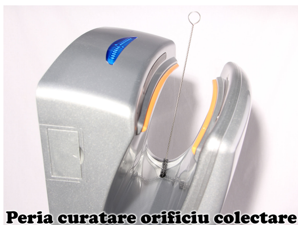
Peria curatare orificiu colectare