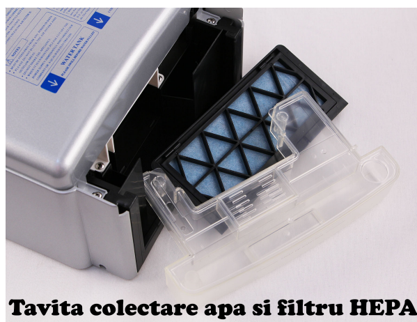
Tavita colectare apa si filtru HEPA