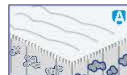
DUPĂ utilizarea ALLERGOFF® spray – alergenii din mediul înconjurător sunt eliminați