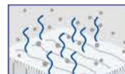
ÎNAINTE de a utiliza ALLERGOFF® spray – alergenii plutesc în mediul înconjurător

Atunci când ALLERGOFF® spray este aplicat pe suprafață, microcapsulele formează o peliculă de polimer care lipește alergenii de praful între ei, formând în particule mai mari, împiedicându-i să plutească în aer și permițând alergenilor agregarea pentru a fi îndepărtați cu ajutorul aspiratorului convențional. Ca urmare, riscul de inhalare a alergenilor este redus.